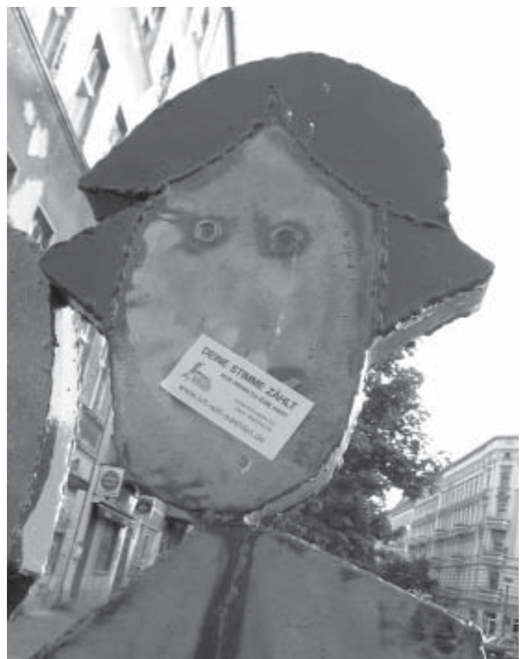
DEINE STIMME ZÄHLT - NUR WENN DU EINE HAST

* hier handelt es sich wahrscheinlich um ein Missverständnis. Wir haben die Junge Union wie auch die Schülerunion per E-Mail über die Kampagne ICH WILL WÄHLEN informiert.