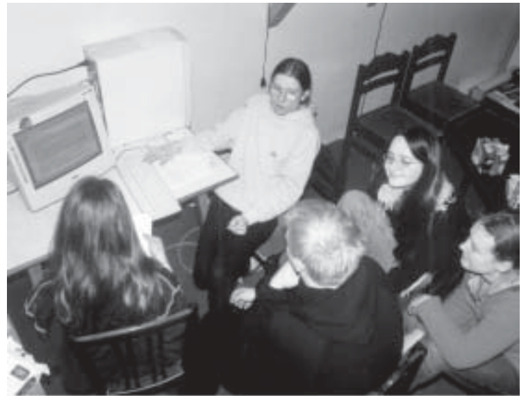
ENTSTEHUNG DES PETITIONSTEXTES AM ERSTEN TREFFEN

Bitte schaffen Sie die rechtlichen Voraussetzungen, damit ich an Wahlen bzw. Abstimmungen – höchstpersönlich und ohne Stellvertretung durch Eltern – teilnehmen kann.