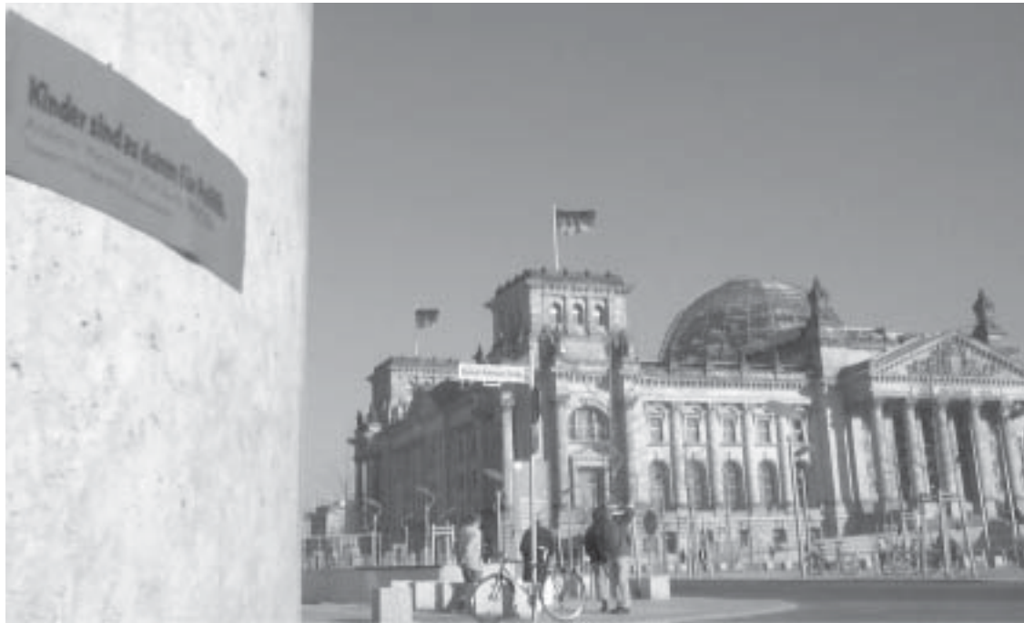
„KINDER SIND ZU DUMM FÜR POLITIK“