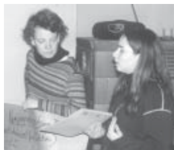
ARBEITSTREFFEN ZUM START DER KAMPAGNE AM 10. MÄRZ 2002